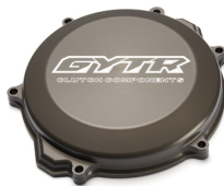
Pokrywa sprzęgła GYTR®