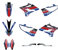
Zestaw naklejek do modelu YZ250