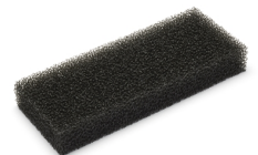
Wkładka zabezpieczająca płytę ochronną

Więcej akcesoriów do YZ250 znajdziesz na stronie internetowej oraz u dealerów Yamaha