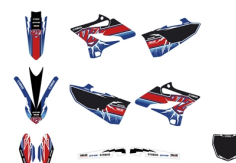
Zestaw naklejek do modelu YZ125

Więcej akcesoriów do YZ125 znajdziesz na stronie internetowej oraz u dealerów Yamaha