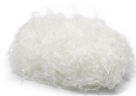
Pakiet uzupełniający tłumika GYTR®