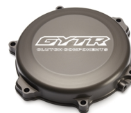
Aluminiowa pokrywa sprzęgła GYTR®