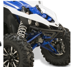
Pustynny przedni uchwyt

Więcej akcesoriów do YXZ1000R / SE znajdziesz na stronie internetowej oraz u dealerów Yamaha