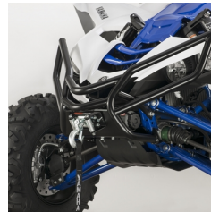
Terenowy przedni uchwyt z mocowaniem wyciągarki