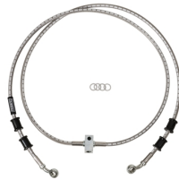
Przednie przewody hamulcowe w oplocie ze stali nierdzewnej GYTR®