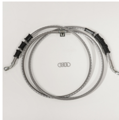
Tylne przewody hamulcowe w oplocie ze stali nierdzewnej GYTR®