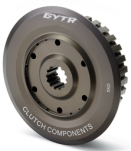
Zabierak sprzęgła GYTR®