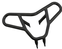
Aluminiowy sportowy przedni zderzak