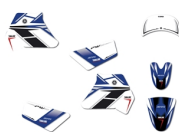
Zestaw naklejek do modelu PW50