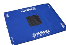
Matą roboczą Yamaha Off-road

Więcej akcesoriów do PW50 znajdziesz na stronie internetowej oraz u dealerów Yamaha