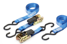
Pasy mocujące z mechanizmem napinającym Yamaha