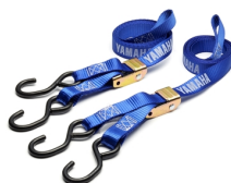
Pasy mocujące z zaczepami Yamaha