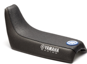
Skórzana kanapa do modelu PW50