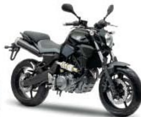
MT-03 – Midnight Black (SMX)