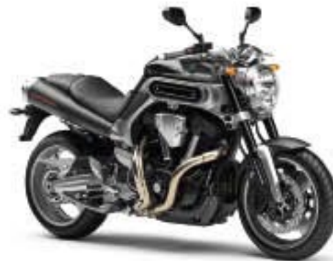
MT-01 – Graphite (DNMG)