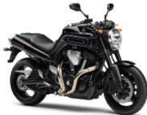
MT-01 – Midnight Black (SMX)