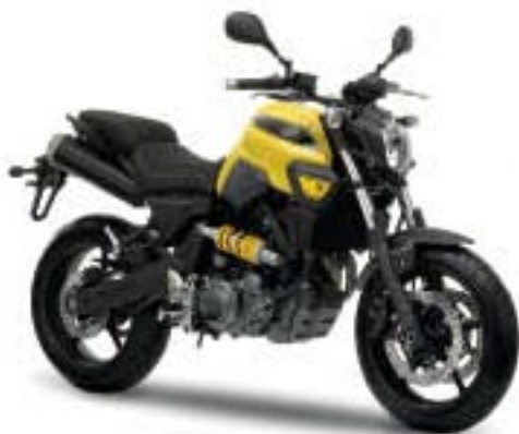
MT-03 – Extreme Yellow (RYC1)