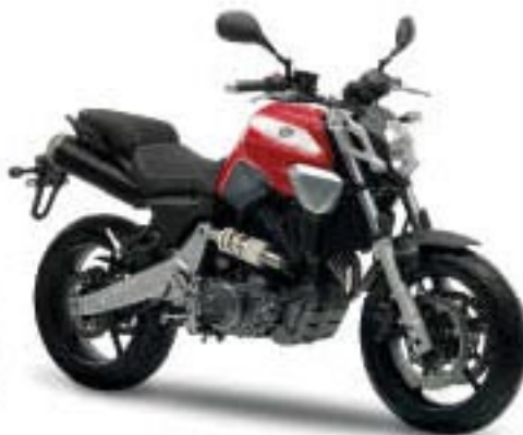
MT-03 – Racing Red (VRC1)